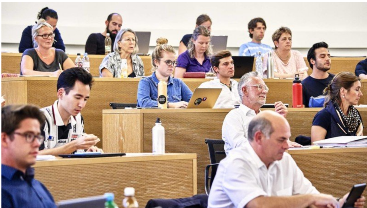
Der Einwohnerrat sagt zwei Mal klar Ja zum Stadion (Colin Frei)